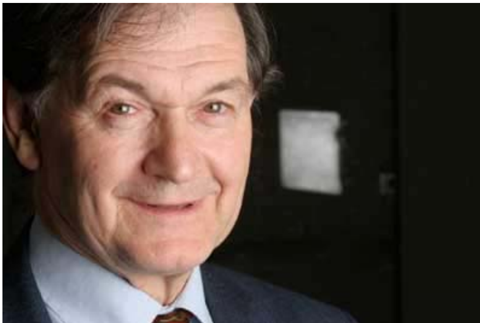
Roger Penrose en 2005

Sir Roger Penrose (8-8-31 Inglaterra) es en la actualidad uno de los mas prestigiosos y conocidos científicos en el ámbito fisicomatemático y astrofísico principalmente en lo referente al tema de los agujeros negros y el origen y evolución del universo, sobre el cual ha elaborado fuertes hipótesis, muchas en colaboración con Stephen Hawking a la vez que colaborando con éste en la autoría de textos científicos y de divulgación rigurosa. En los últimos años se ha dedicado a investigaciones y elaborado hipótesis de poderosa lógica interna sobre la mente y la conciencia razonadas en base a la