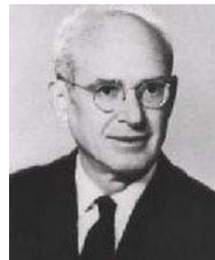
Nathan Rosen (1909-1995)

La MC explica la correspondencia entre lo que acontece en A con lo que acontece en B, argumentando que en el experimento no hay transmisión de señal, que cuando dos objetos como las partículas citadas, han estado unidas o en interacción, aunque se separen a cualquier distancia, la correlación de acciones entre ellas continúa como cuando estaban junta o en