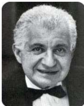
Boris Podolsky (1896-1966)