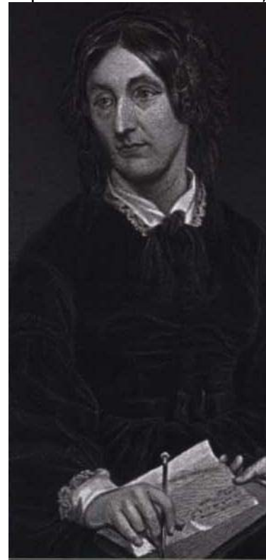
Mary Somerville. Su libro The Connection of the Physical Sciences constituye un profundo ensayo filosófico con una amplia explicación científica acerca de los fundamentos de las fuerzas que mueven el universo.

El ejemplo de Harvard cundió rápidamente y cuando, en 1982, el Observatorio de París planteó el proyecto de cartografiado de todas las estrellas hasta magnitud once mediante la utilización de placas fotográficas, La Carte du Ciel , los observatorios participantes, veinte en total, consideraron que resultaba más barato y eficiente emplear a mujeres. Eva Isaksson estima que solo en el Observatorio de Helsinki el trabajo realizado por el equipo de mujeres equivale a 168 trabajadores a tiempo completo durante el tiempo de duración del proyecto. Lo sorprendente de