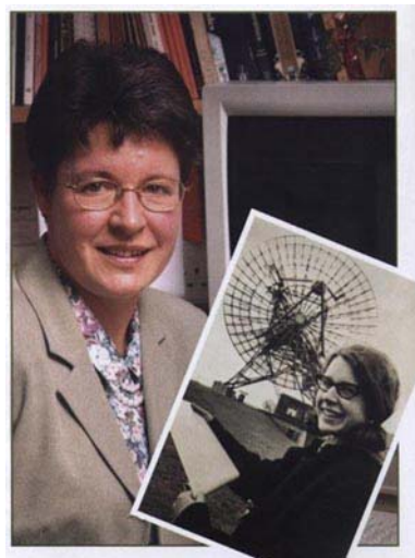
Jocelyn Bell. A lo largo de su vida ha sido una gran promotora del trabajo de las mujeres. En un artículo reciente escribía: "Aunque el avance y el reconocimiento de las mujeres astrónomas venga a rachas y de modo inesperado, como el estudio de los púlsares, espero que se aceleren en el futuro.