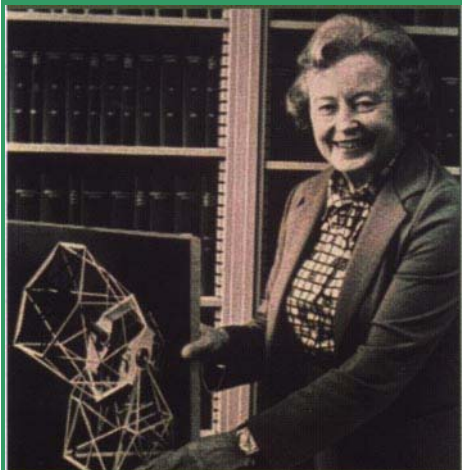
Margaret Burbidge. Ella escribe en su biografía sobre el rechazo de la Institución Carnegie para observar en el observatorio de Monte Wilson: "... si los esfuerzos se ven frustrados por un muro de piedra o cualquier otro tipo de bloqueo, una debe encontrar otro camino hacia su meta...".

esa dificultad. Este hecho singular marcó su trayectoria posterior aportándole un carácter duro y agresivo. Su carrera investigadora se ha desarrollado entre Inglaterra y Estados Unidos donde, además de una trayectoria curricular brillante, ha ocupado cargos tan relevantes como directora del Royal Greenwich Observatory y presidenta de la American Astronomical Society . Charlotte Moore Sitterly (1898-1990) fue una eminente astrónoma americana que organizó, analizó y publicó los libros básicos sobre el espectro solar. Desde 1945 hasta su muerte trabajó en el U.S. National Bureau of Standards and the Royal Naval Research Laboratory . Entre sus contribuciones cabe destacar la compilación de las tablas de niveles atómicos de energía que se utilizan como material de referencia Standard. Debido al escaso papel político que ha jugado en la Astronomía, se dispone de pocos datos biográficos personales, pero su legado científico fue tan relevante que le dieron la medalla a título póstumo en 1990.