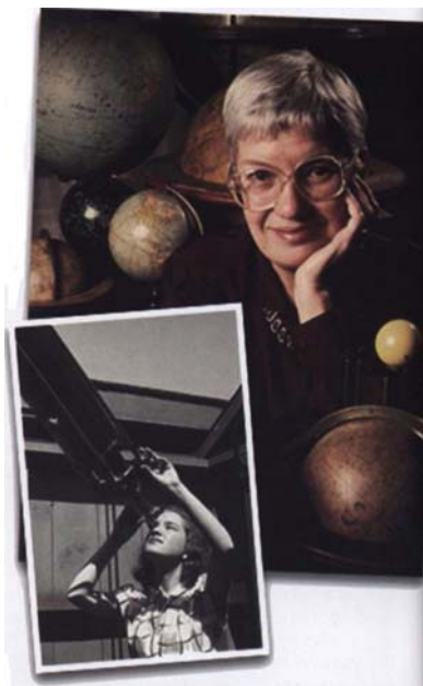
Vera Rubin. De ella el Washington Post escribió: "madre joven encuentra el centro de la creación o algo así", para hacerse eco de la discusión que planteó con la presentación de los resultados de su Máster en una reunión de la American Astronomical Society .

Quiero terminar mi pequeño homenaje a estas mujeres astrónomas con una frase de Jocelyn ( Science 304, p. 489, 2004): " Las mujeres y las minorías no deberían hacer todo el esfuerzo de adaptación. Es momento de que la sociedad se movilice hacia las mujeres, y no las mujeres hacia la sociedad ".