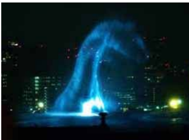
Ejemplo de holograma

Quienes sólo conozcan el título, podrán pensar que el poema es un canto a la belleza de un holograma, pero no es así. En el poema L´Holograma , se utiliza con singular maestría la interpretación filosófica y pudiéramos decir teológica de la peculiaridad física antes descrita que presenta un holograma.