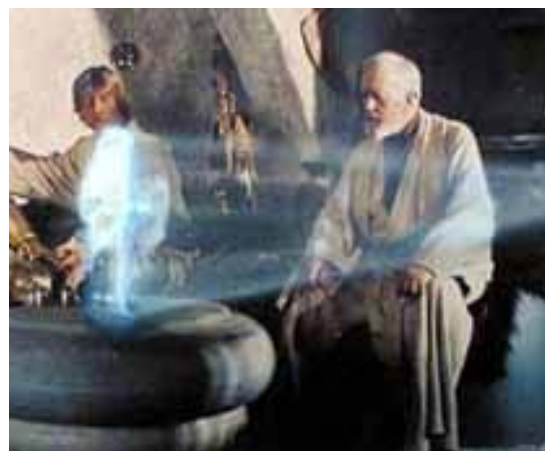
Hologramas en el cine