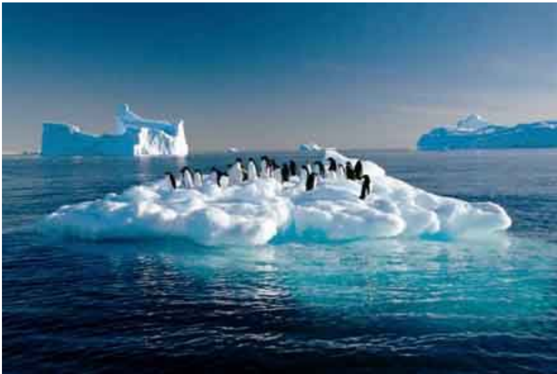
El calentamiento de la atmósfera ya se manifiesta ostensiblemente con el derretimiento del casquete de hielo de ambos polos

La elevación de temperatura debida al Efecto Invernadero produce un calentamiento en la atmósfera del planeta que por su efecto crucial en el Cambio Climático es motivo de prioritaria atención por el IPCC y denomina el tema Calentamiento Global . El calentamiento de la atmósfera ya se manifiesta ostensiblemente con el derretimiento del casquete de hielo de ambos polos, lo cual conlleva a la ya preocupante elevación del nivel del mar, el cual ha provocado la desaparición de islotes e inundaciones en zonas costeras de algunos territorios como el caso de Miami Beach y el peligro que corre la estructura de la simbólica Estatua de la Libertad en Estados Unidos. En definitiva, el peligro de un desastre ecológico.